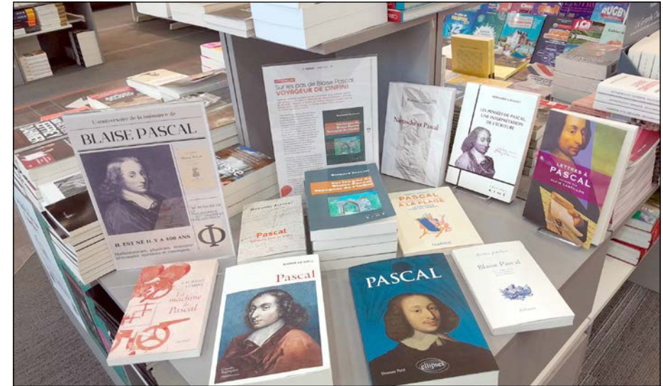
À la librairie Agora, La Roche-sur-Yon : Pascal est à l'honneur pour les 400 ans de sa naissance.